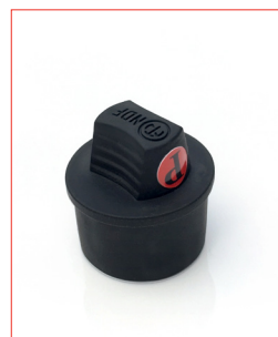
XLR-Cap (for female) Stk. € 18,- / 10 Stk. € 150,-