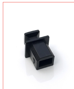
USB-B-Plug Stk. € 13,- / 10 Stk. € 100,-