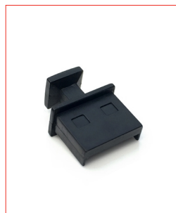
USB-A-Plug Stk. € 13,- / 10 Stk. € 100,-