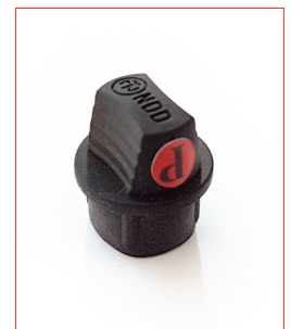
DIN-Plug Stk. € 18,- / 10 Stk. € 150,-