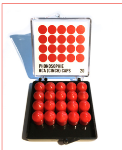
RCA (Cinch) Caps Stk. € 7,- / 20 Stk. € 100,-