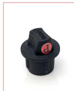
XLR-Cap (for male) Stk. € 18,- / 10 Stk. € 150,-