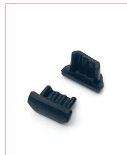
USB-Micro-Plug Stk. € 13,- / 10 Stk. € 100,-