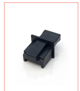
RJ45-Plug (Ethernet) Stk. € 13,- / 10 Stk. € 100,-