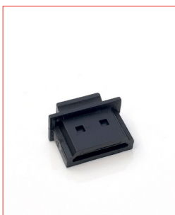
HDMI-Plug Stk. € 13,- / 10 Stk. € 100,-