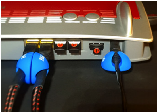
E64-Clips an einem Router