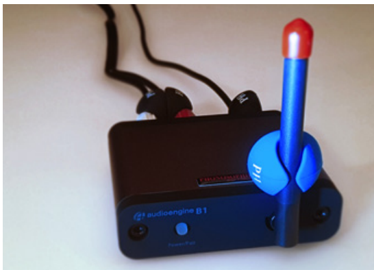
E64-Clip an der Funk-Antenne eines Bluetooth-Übertragers