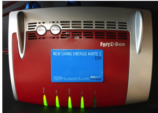
E64-Karte auf einem Router