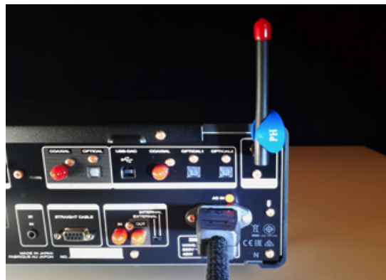
E64-Clip an einer WLAN-Antenne eine HiFi-Gerätes.

Wir sind verpflichtet darauf hinzuweisen, dass PHONOSOPHIE New Living, wie auch E64 Produkte, keine medizinischen Produkte sind. Bei unseren Aussagen berufen wir uns ausschließlich auf unsere eigenen Erfahrungen und Untersuchungen.