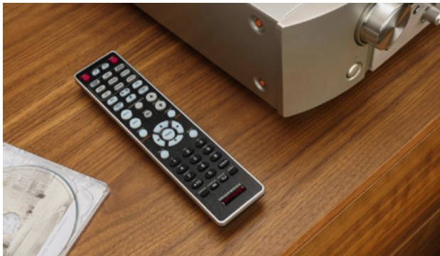
Die Fernbedienung liegt gut in der Hand und bietet eine Reihe von praktischen Schnellzugriffs-Tasten. Mit ihr ist außerdem die Menünavigation von der Couch aus möglich.