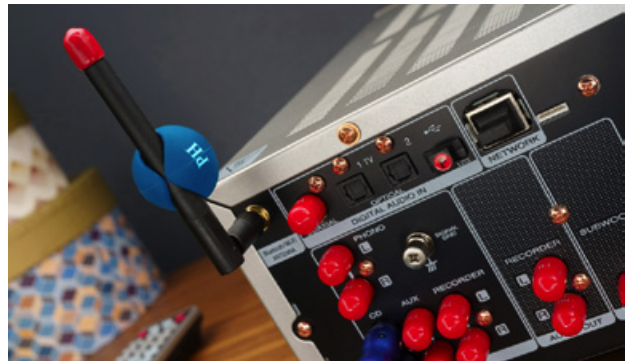
Die Caps aus Phonosophies Zubehörsortiment können klangverschlechternde Interaktionen mit Umwelteinflüssen optimieren.