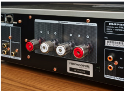
Die Lautsprecherklemmen des Verstärkers sind ausgezeichnet verarbeitet und bieten Kabeln aller Art festen Halt.

Dabei ist es interessant zu sehen, dass sich auch der ursprüngliche Hersteller bereits Gedanken zur Klangoptimierung gemacht hat. So lassen sich WLAN und Bluetooth ebenso abschalten wie die Wiedergabe per Netzwerk oder USB. Dadurch können hochfrequente Störanteile bei der analogen Audiowiedergabe bereits vermindert werden. Doch es ist gerade die gute Funktions- und Anschlussvielfalt, die den MR PM7000N für viele Nutzer interessant macht. Darum bietet der Verstärker auch einen speziellen Modus, bei dem die interne Klangregelung vollständig umgangen wird. Und ein kürzerer Signalweg mit möglichst wenig Bauteilen dazwischen, resultiert üblicherweise auch in besserem Klang. Da könnte man beinahe meinen, dass zusätzliches Klangtuning sinnfrei wäre. Doch auch hier gibt es immer noch Möglichkeiten für Verbesserungen, von denen Phonosophie bei seinem überarbeiteten Modell gleich mehrere implementiert hat. Dazu zählt zunächst die firmeneigene Aktivator-technik, mit der verschiedene Bauteile des Verstärkers versehen wurden. So sollen Störeinflüsse auf Kondensatoren, Platinen und Gehäuse vermindert werden.