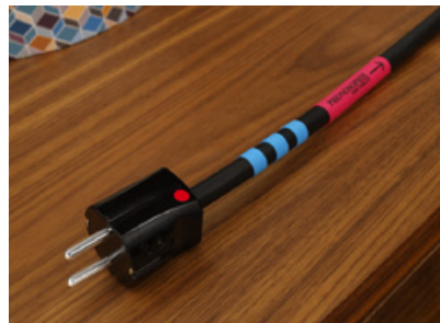
Das hochwertige Netzkabel, das dem Verstärker beiliegt, kann bei Phonosophie auch einzeln geordert werden. So lassen sich auch angeschlossene Quellgeräte optimieren.