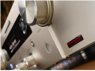
Am Design des Vollverstärkers wurde nicht gerüttelt. Nur einige dezente Typenschilder weisen auf das Tuning hin.