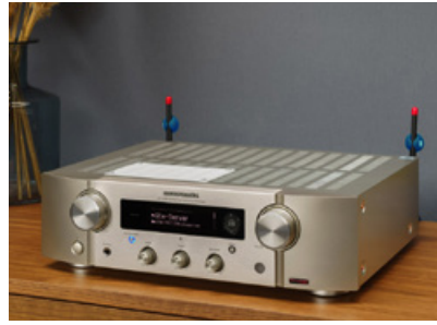
Marantz nutzt für das Design eine Kombination aus klassischen HiFi-Elementen und moderner Zurückhaltung. Phonosophie kümmert sich ausschließlich um besseren Klang.