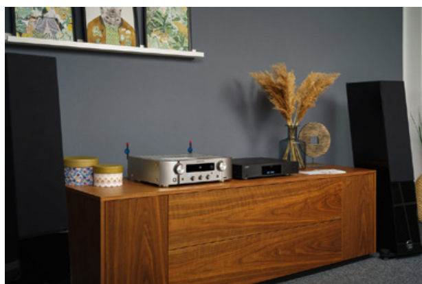
Die Endstufen des MR PM7000N bieten ausreichend Leistung, um auch große Lautsprecher problemlos anzutreiben. Dabei behält das All-in-one System die Chassis, selbst bei erhöhter Lautstärke, stets unter Kontrolle.