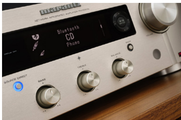
Mit dem betätigen der Source Direct Taste, wird die interne Klangregelung des MR PM7000N umgangen.

Mit Leitungen aus 99,9 prozentigem Kupfer und Materialübergängen und Kontakten aus einer hochwertigen Silberlegierung, soll das Kabel dem All-in-one nochmals klanglich auf die Sprünge helfen. Für optimale Ergebnisse, sollte dabei auf einen phasenrichtigen Anschluss geachtet werden. Kabel und Verstärker sind dafür bereits entsprechend markiert. Um die korrekte Ausrichtung zu finden, muss man nur noch einen Phasenprüfer an den markierten Kontakt halten und mit dem Finger das obere Ende des Prüfers antippen. Leuchtet die Glimmlampe im Innern auf, ist alles korrekt. Falls nicht, muss nur der Stecker um 180 Grad gedreht werden. Für einen fairen Test, habe ich zuvor natürlich auch das Allerweltskabel richtig angeschlossen. Trotzdem steigert sich der MR PM7000N mit dem hochwertigen Kabel merklich. Die Bühnendarstellung ist nun deutlich offener und „The Ecstasy of Gold“ erklingt wunderbar groß und atmosphärisch. Wirkten die Trompeten zuvor teils noch etwas ausgefranst, gibt es jetzt klaren, silbrigen Klang.