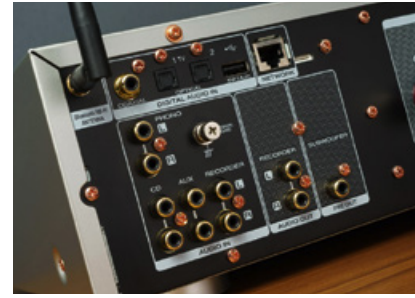
Digitale und analoge Anschlüsse, inklusive eines Phono-Eingangs, gehen beim MR PM7000N Hand in Hand. Einzig auf einen HDMI-Port wurde verzichtet.