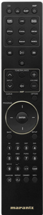
Die MARANTZ Systemfernbedienung

Alle Preise sind unverbindliche Preisempfehlungen inkl. 19% MwSt. Irrtum und Änderungen vorbehalten. Stand: August 2021. Alle vorherigen Preislisten verlieren hiermit ihre Gültigkeit.