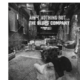
Astor Piazzolla, Oblivion, Salvatore Accardo, Fone / LP; Anne Clark, Borderland, Stockfisch / LP; The Blues Company, Ain't Nothing But..., Inakustik / LP

griffiger, Anschläge definierter, Saitennachschwingungen vollständiger. Stimmen gewinnen an Farbe und stofflicher Präsenz. Besonders bemerkenswert ist, dass die Musik mit Aktivator Basalt nicht „aufgedreht“ wirkt, sondern im Gegenteil entspannter. Die Abbildung steht fester, die Bühne wirkt tiefer und zugleich selbstverständlicher. Feinste Hallräume, kurze Reflexionen und die Einbettung der Stimme in den Aufnahmeort treten plastischer hervor. Wo ohne Aktivator vielleicht schon eine gute, saubere Reproduktion vorliegt, öffnet sich mit den Basaltplatten eine zusätzliche Dimension der Glaubwürdigkeit. Man hat nicht das Gefühl, mehr Hifi zu hören, sondern weniger Störung zwischen Musik und Wahrnehmung. Gerade diese Qualität macht den besonderen Reiz aus. Stockfisch-Aufnahmen leben von Nuance und Timing, und genau dort arbeiten die Basaltplatten offenbar am wirkungsvollsten: Sie bringen mehr Ruhe in die Abbildung, mehr Zusammenhang in die Dynamik und mehr Körper in die Klangfarben.